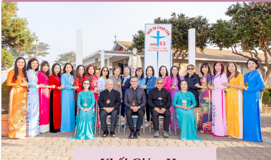
Khối Giám Học