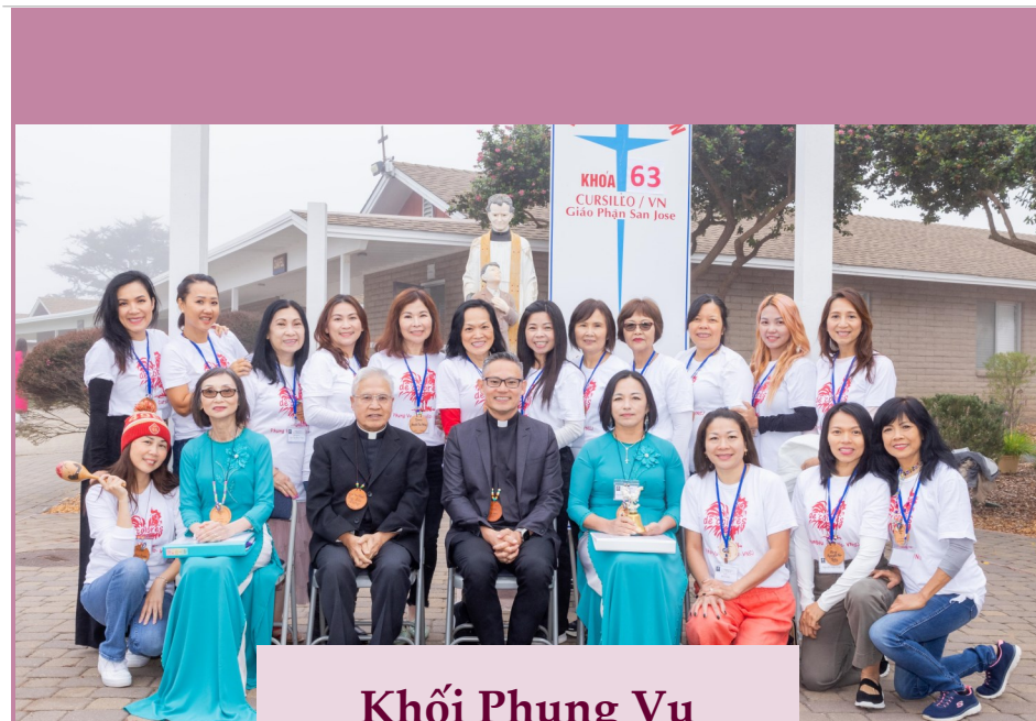
Khối Phụng Vụ