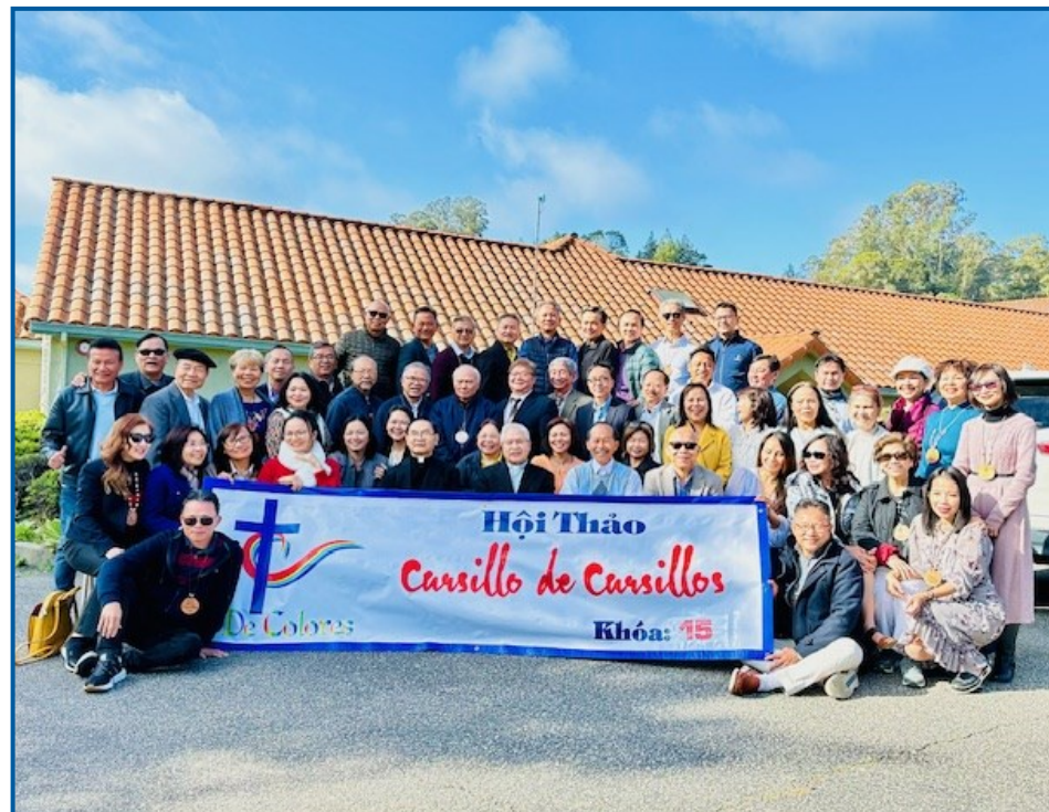
Miền XI - Khóa 15- 4/2024 Thiên Phước-Aptos

Điều răn thứ nhất trong đạo Công Giáo là “Thờ phượng và kính mến Thiên Chúa trên hết mọi sự.” Điều này có nghĩa là không được thờ lạy, tôn thờ hay kính sợ bất kỳ thần thánh nào khác ngoài Thiên Chúa. Câu hỏi đặt ra là: Phải chăng Thiên Chúa của chúng ta quá ư là độc tài? Thiên Chúa là Đấng toàn năng, Ngài hiểu rằng chính Ngài mới có khả năng ban sự sống cho con người, và không còn thần nào khác có thể làm được như vậy. Điều này không phải là độc tài, mà là sự thật về bản chất của Thiên Chúa. Ngài là Đấng Tạo Hóa duy nhất, Đấng ban sự sống và duy trì sự sống của vũ trụ. Ngài