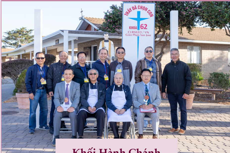
Khối Hành Chánh