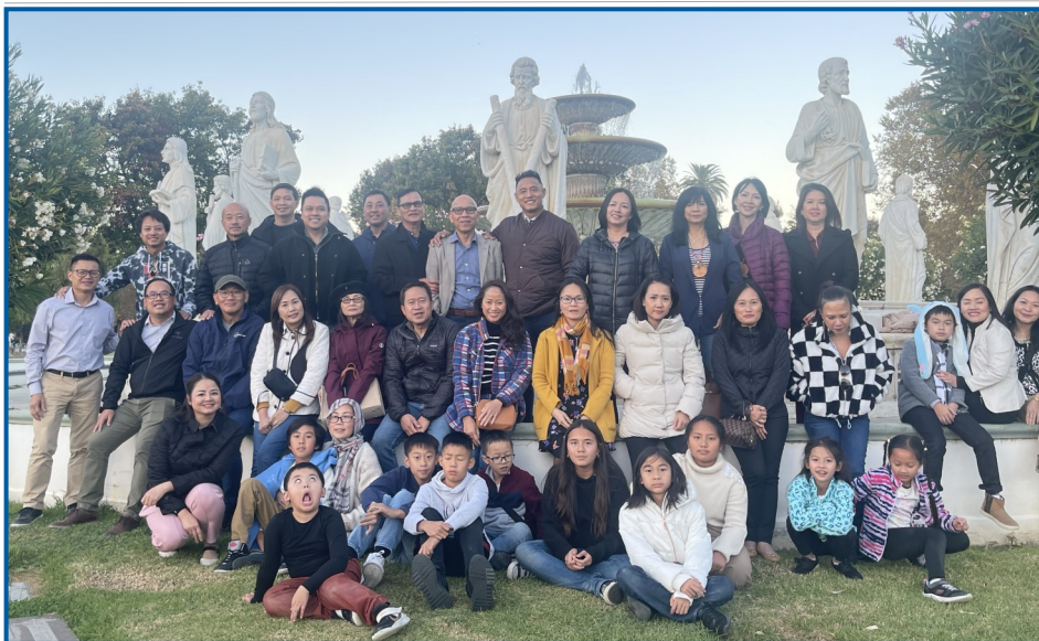
ĐỌC KINH NGHĨA TRANG OAK HILL 11/2024