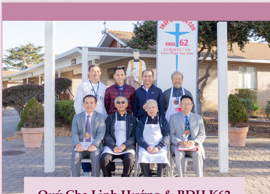
Quý Cha Linh Hướng & BDH K62