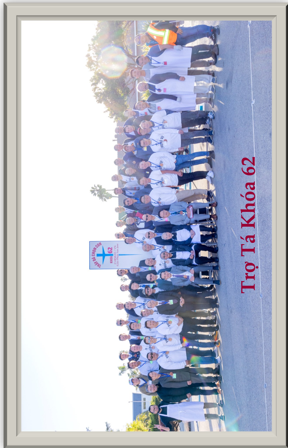
Trợ Tá Khóa 62

Lạy Chúa, như một thanh kiếm, để trở nên sắc bén, và hữu dụng, nó phải trải qua bao công đoạn, mài dũa đau thương. Phải chẳng, qua những hối hận,