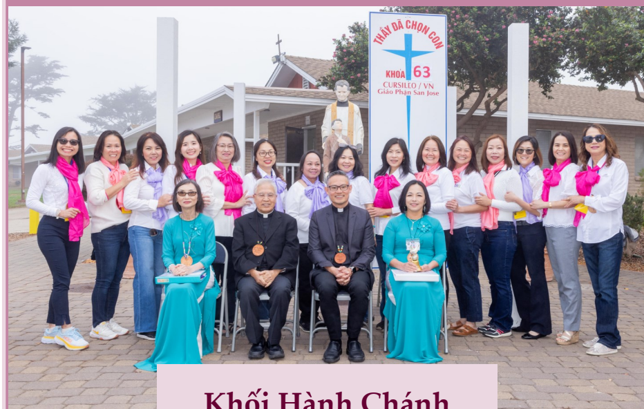
Khối Hành Chánh