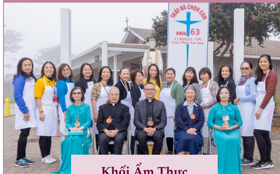
Khối Âm Thực