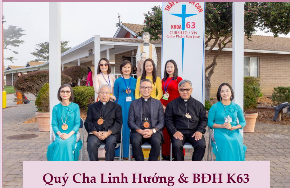
Quý Cha Linh Hướng & BDH K63

Chúa khai mở. Mỗi lần bước vào khóa tĩnh tâm đồng hành với các Cur-sillistas, anh chị em đến khóa với một tấm lòng mệt mỏi, chán chường, và khao khát “được yêu,” và cứ y như rằng mỗi khi kết thúc khóa, tôi thấy những tiếng cười rạng rỡ, những ánh mắt rực sáng muốn lên đường sứ vụ làm vang danh Chúa trong đời sống chúng tá giữa dòng đời, những trái tim khao khát chia sẻ tình yêu cho những người khác mà các Cur-sillistas gặp gỡ trong cuộc sống, và những trái tim đầy tin yêu và hy vọng. Hôm nay, chúng ta cùng với Giáo hội bước vào Năm Thánh 2025. Đức Thánh Cha Phanxicô công bố Năm Thánh này là: “Những Người Hành