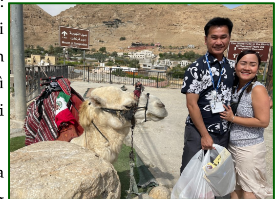
Thành phố Jericho ngày 22 tháng 2, 2022

Cảnh vật ở Jesuit Retreat Center rất đẹp, trong tĩnh lặng tôi thấy nhẹ nhàng hơn, suy nghĩ rõ ràng hơn. Tôi mời Chúa dẫn dắt và Ngài đưa tôi đi trên con đường Rosary để cầu nguyện trong bối cảnh này. Dẫu biết con đường này không phải là Jericho, thành phố cổ nhất của