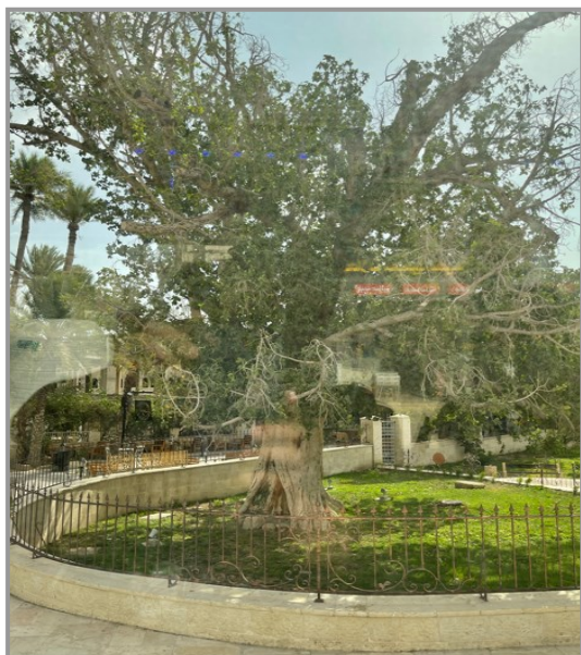
Vị trí Chúa Giêsu gọi Ông Giakêu, Jericho

vệ đường tên Barthemaus lại nổi bật nhất đưa tôi vào sự mật thiết với Thiên Chúa, có thể vì tôi đã in dấu chân qua thành Jericho này. Tôi xin Chúa cho tôi thêm niềm tin để biết Chúa hơn như anh mù Barthemaus, tức thì ngay lúc đó Ngài muốn tôi làm người mù. Tôi cúi xuống nhặt nhánh cây bên vệ đường Rosary làm gậy dẫn đường, nhắm mắt và bước