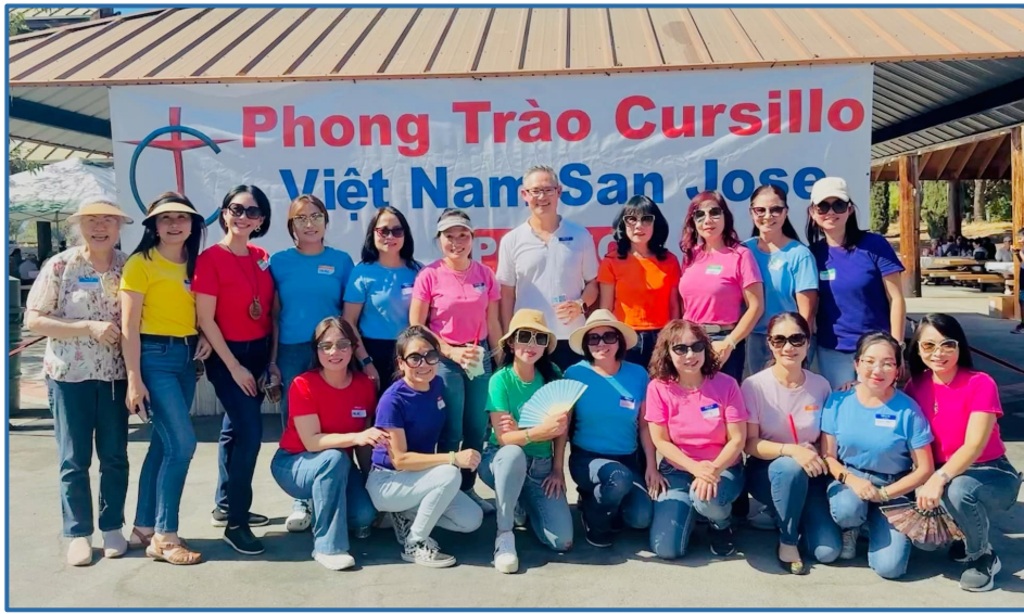
PICNIC OCT 06, 2024