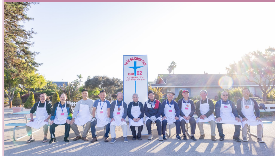
Khôi Âm Thực