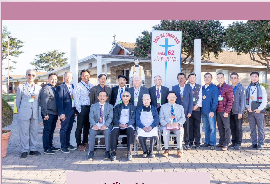
Khối Giám Học

Chúa biết mà! Tâm hồn con thì ngổn ngang, đầy ắp rác rưởi, với những lo toan trần thế.