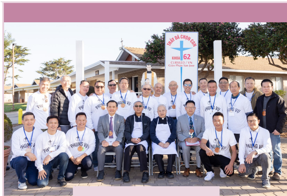
Khôi Phụng Vụ