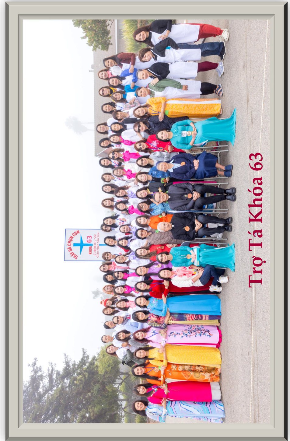
Trọ Tạ Khóa 63

Qua phong trào, tôi cảm nghiệm Chúa dùng một cách khác để đến với anh chị em, và “chạm” vào tâm hồn từng anh chị em, đốt cháy lòng trí nguội lạnh và chai lì của bao nhiêu tâm hồn để anh chị em được cảm thấy mình “được thương” nhờ thần khí